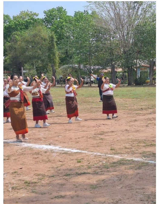
Happy Society (สังคมดี)

การแข่งขันกีฬาถือว่าเป็นการเชื่อมความสัมพันธ์อันดี และสร้างความรักความสามัคคีต่อหน่วยงานได้เป็นอย่างดี สร้างความปรองดองในองค์กรและทำให้องค์กรพัฒนาไปได้อย่างดี