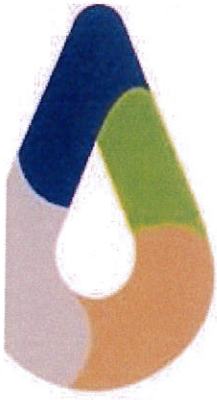
สัญลักษณ์รูปหยดน้ำ

อถล. เป็นการรวมกลุ่มของประชาชนในท้องถิ่นที่มีจิตอาสาในการช่วยเหลืองานขององค์กรปกครองส่วนท้องถิ่น เกี่ยวกับการจัดการสิ่งปฏิกูลและมูลฝอย การปกป้องและรักษาทรัพยากรธรรมชาติและสิ่งแวดล้อม